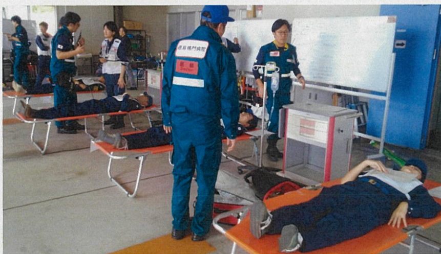
SCUにおいて搬送患者の収容状況