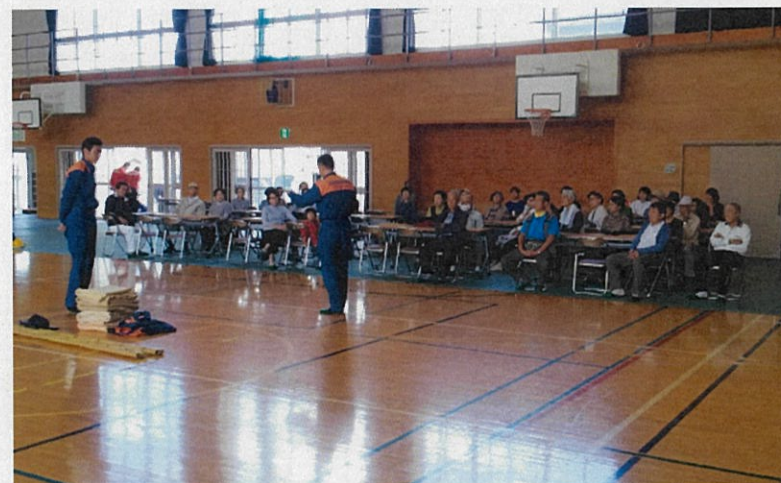
消防職員による救急救助の講話