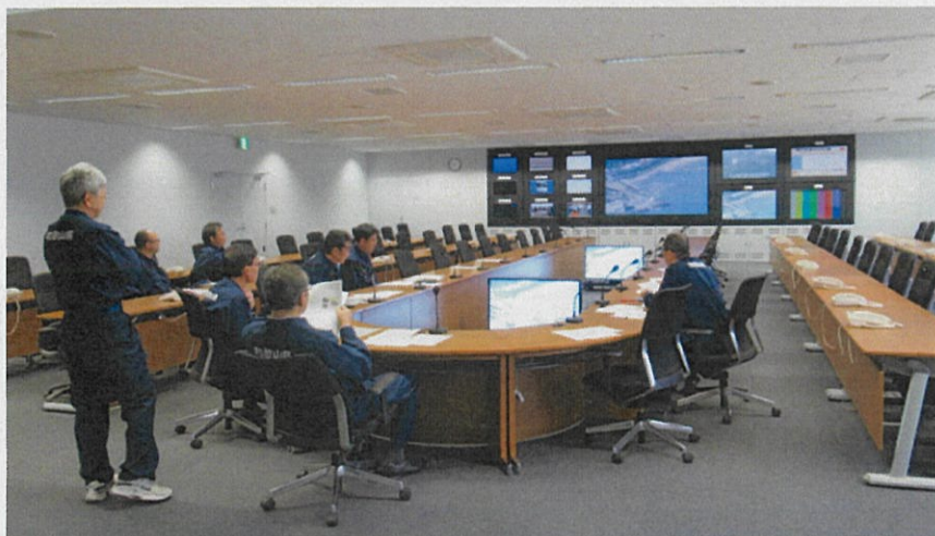
災害対策本部室で訓練状況の映像確認