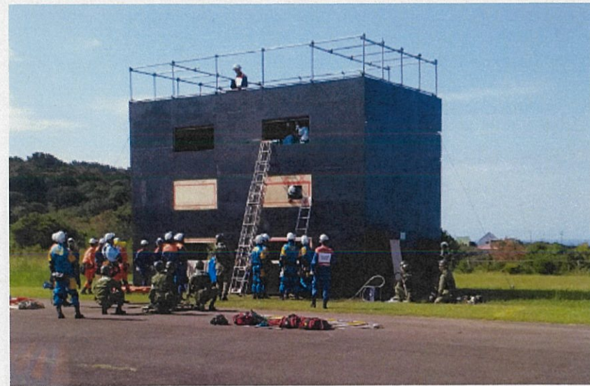
倒壊家屋内に進入し要救護者を救出している状況