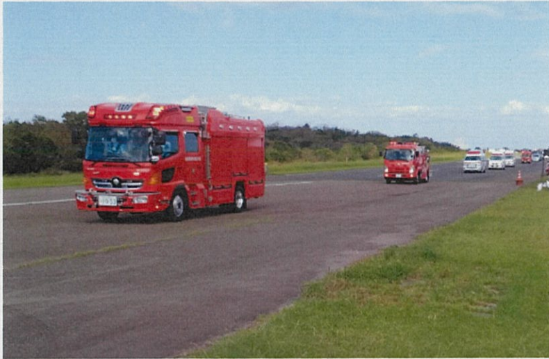
緊急走行による部隊の集結状況