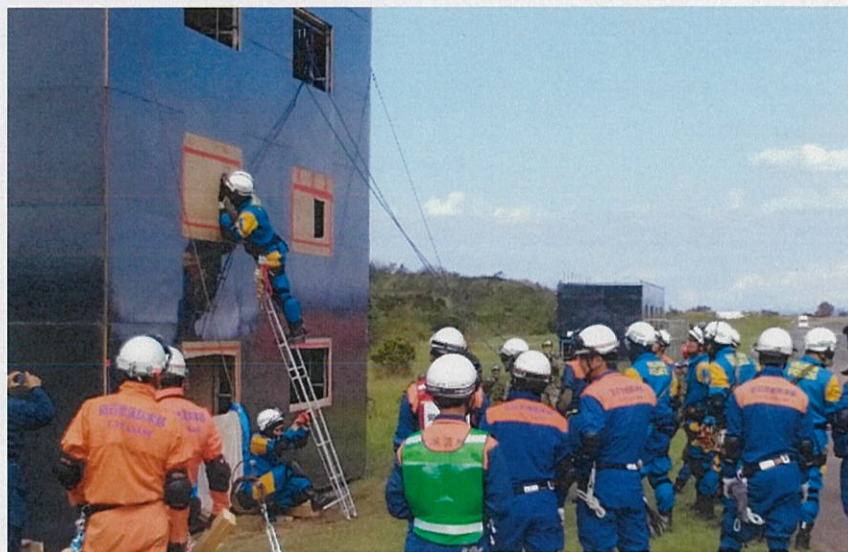
倒壊家屋内に進入する警察部隊