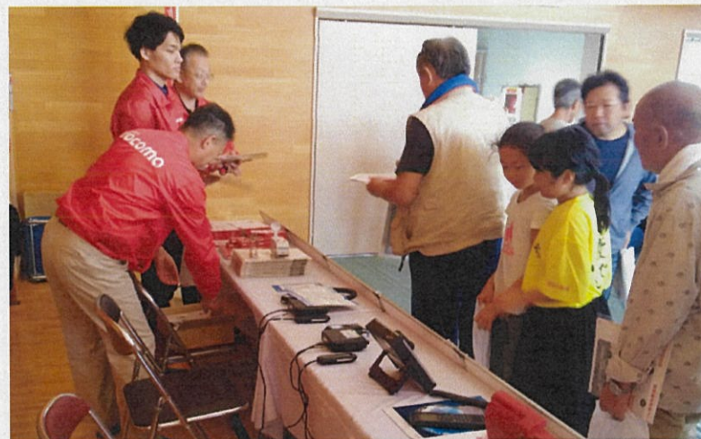
災害時通信機器の展示状況