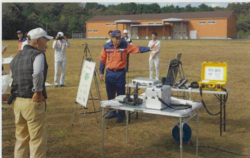
避難住民に対し機器の説明