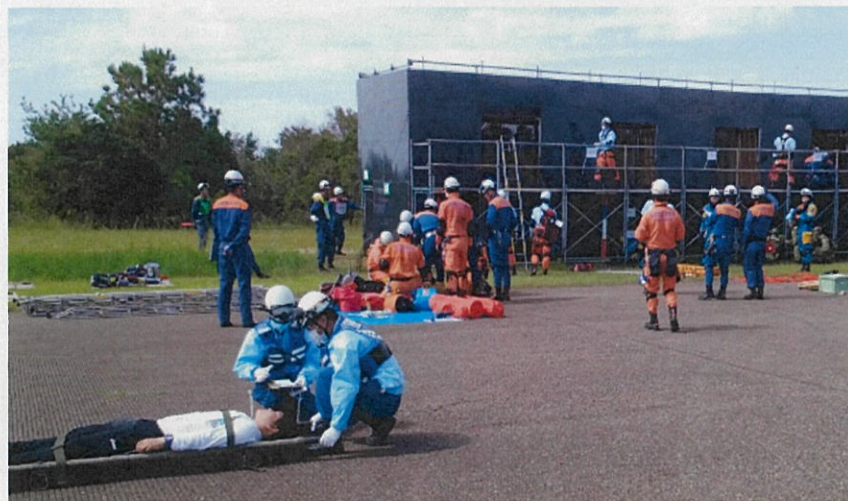
救護者救助の状況