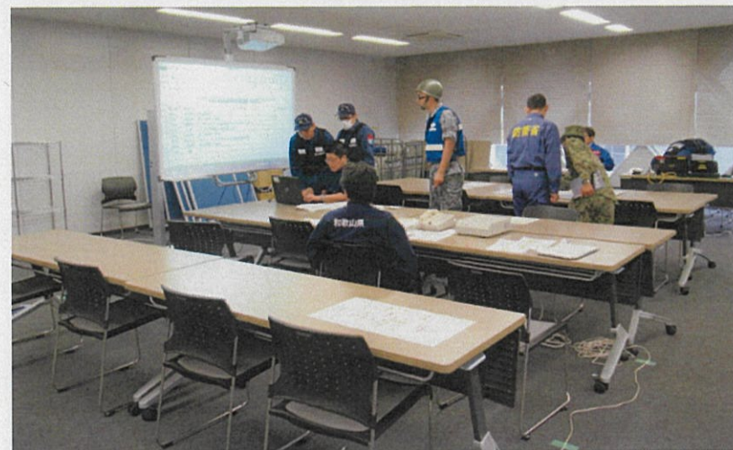
各関係機関の訓練状況を確認