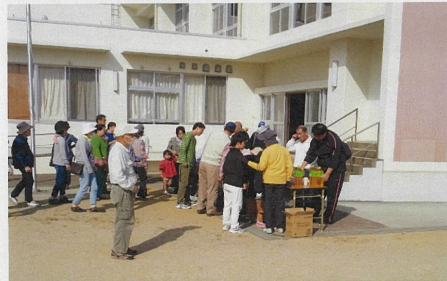
避難所において受付を行っている状況