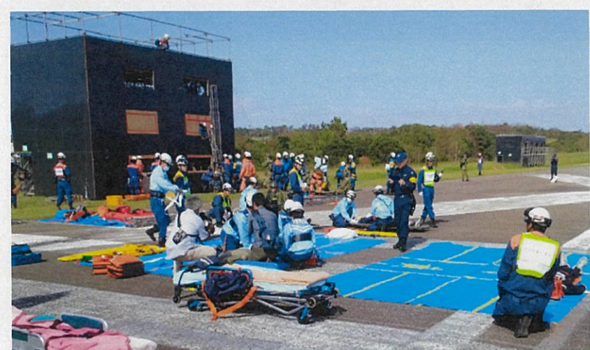
倒壊家屋前における救護者救出の状況