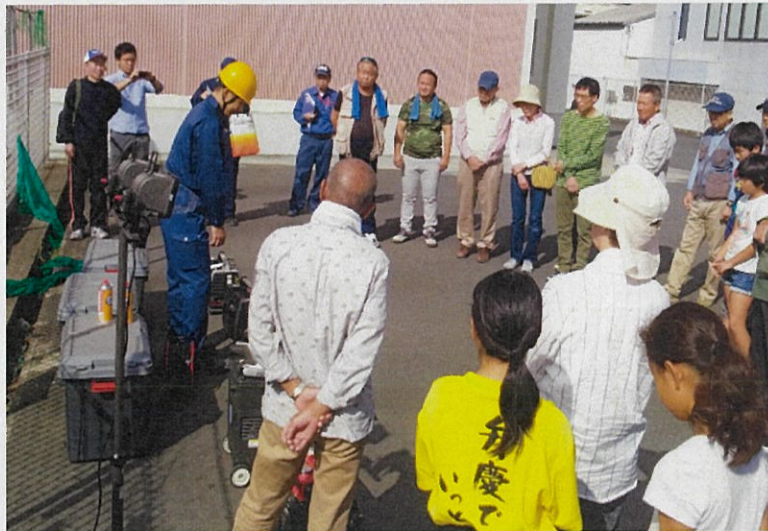
発電機等資機材の説明を受けている状況