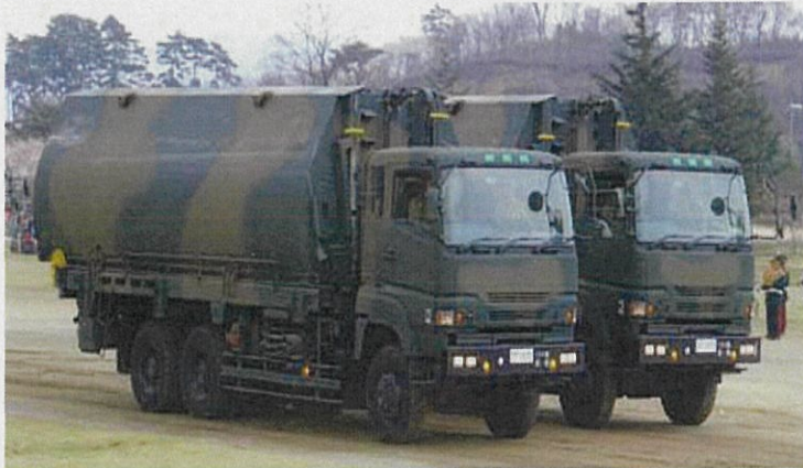
トラックで浮体を搬送