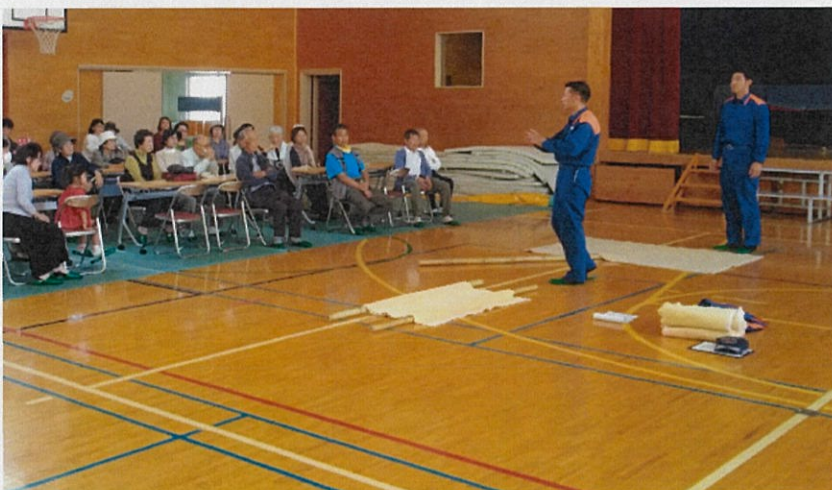
消防職員による救急救助の講話