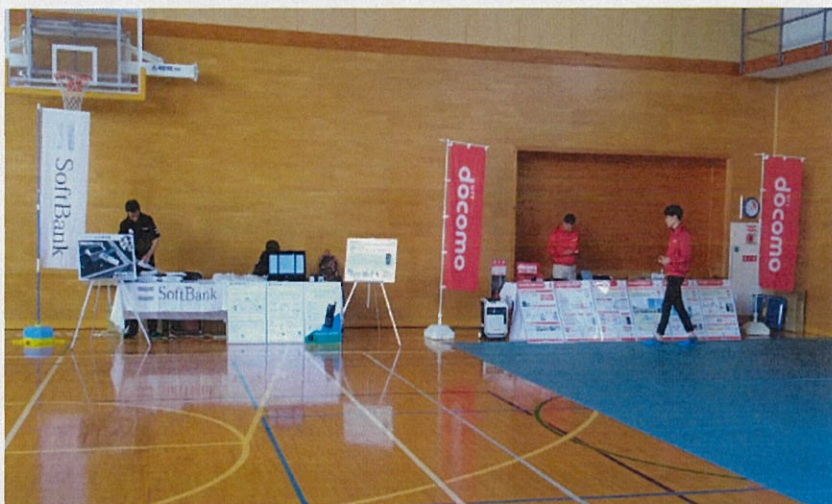
携帯電話事業者による防災・啓発展示の実施状況