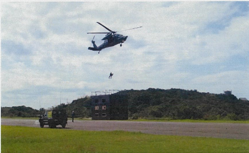
自衛隊ヘリにより倒壊家屋屋上から救助者を救出