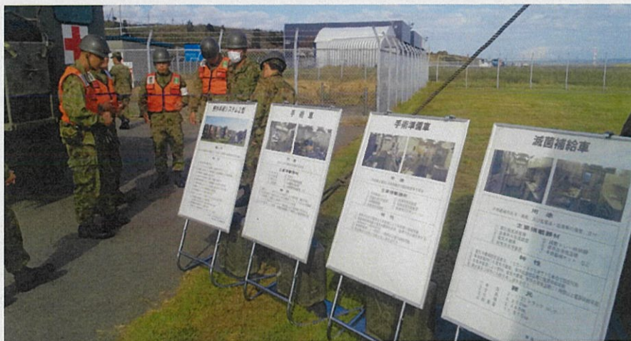
SCUにおいて陸上自衛隊野外手術システム開設