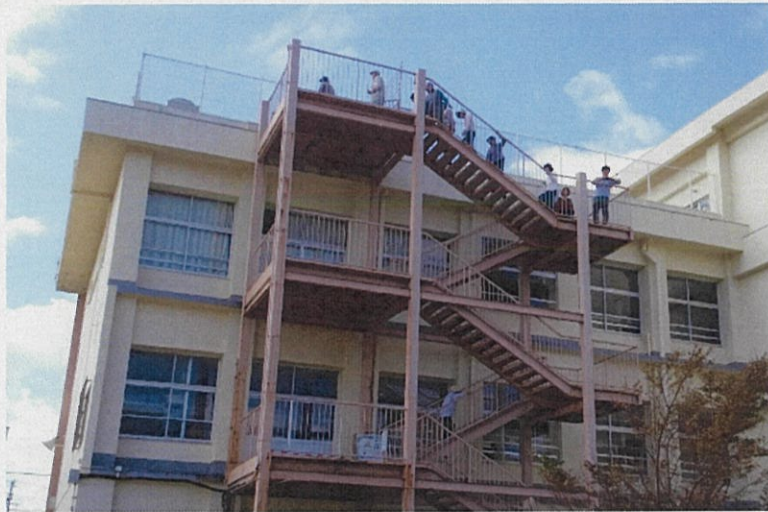
高台へ避難する住民