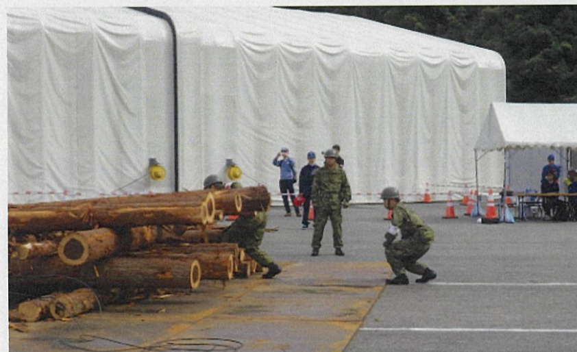
倒木の中から人を救助している状況