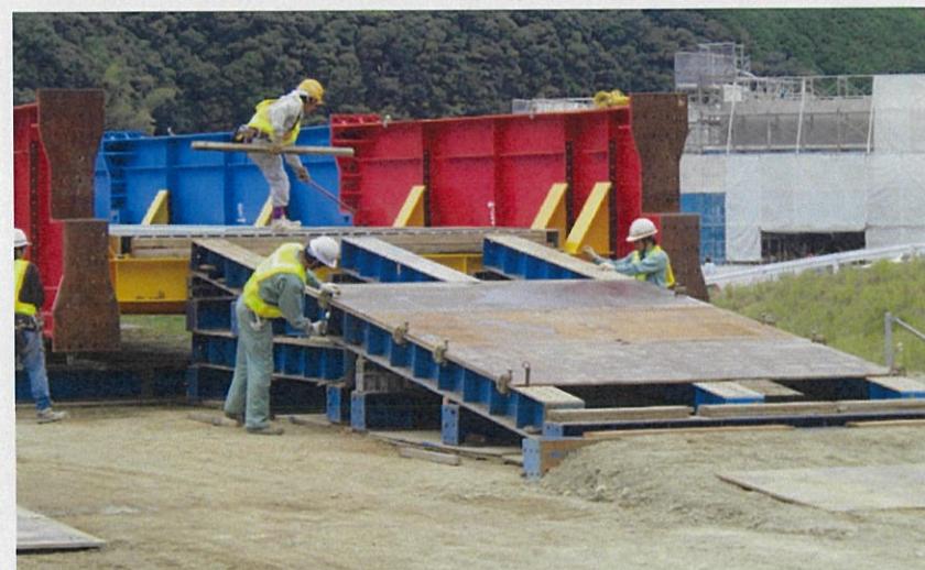
緊急仮設橋の組立状況