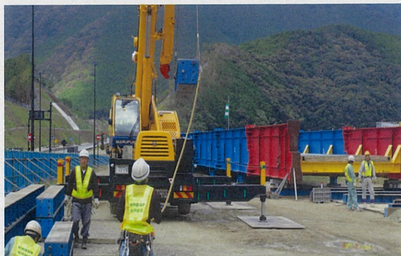
クレーンで橋梁の鉄骨を吊上げている状況