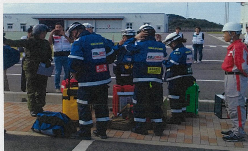
陸上自衛隊ヘリでDMAT移送