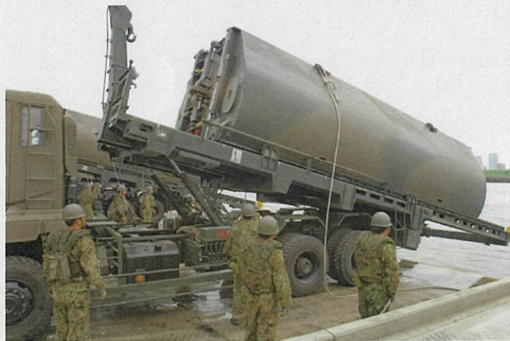
トラックから浮体を河川に投下