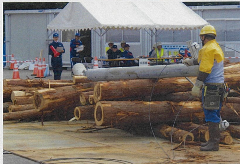
倒木等により塞がれた道路の啓開を実施