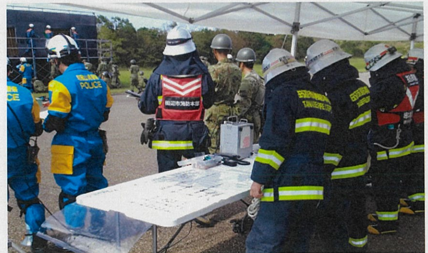
指揮所本部の状況