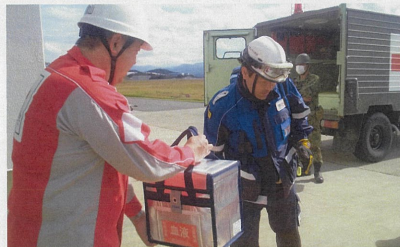
空輸にてSCUに血液が到着