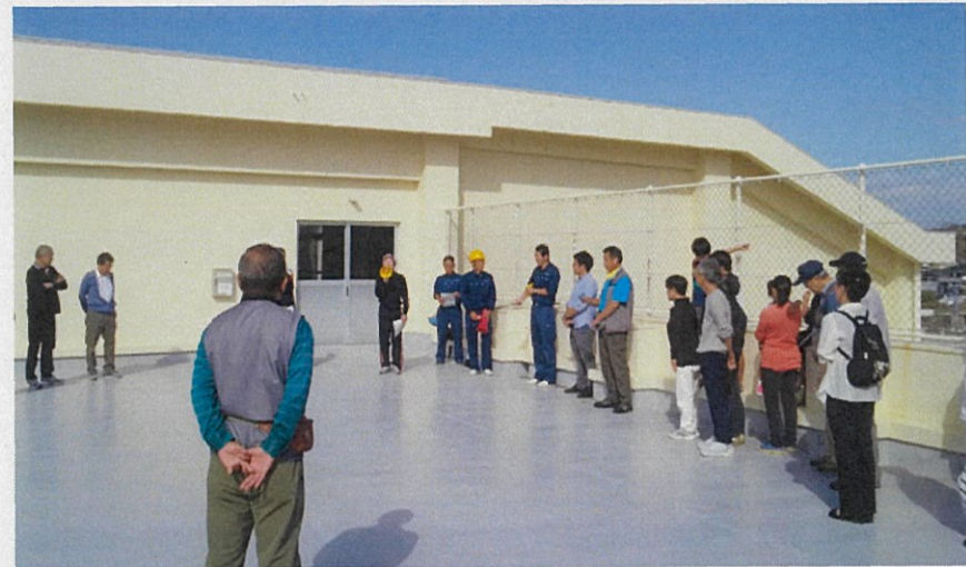
高台で責任者が避難に関する説明を実施