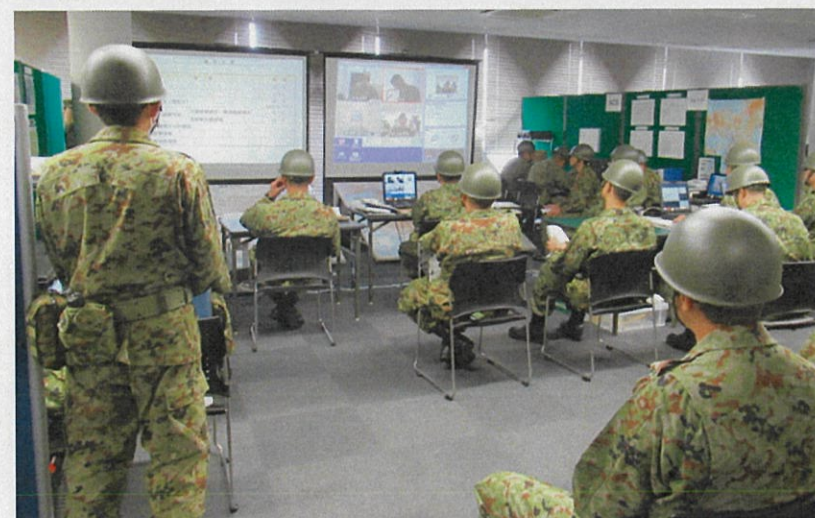
陸上自衛隊現地指揮本部の状況