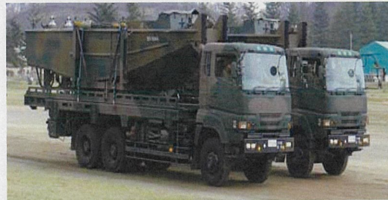
トラックで動力ボートを搬送