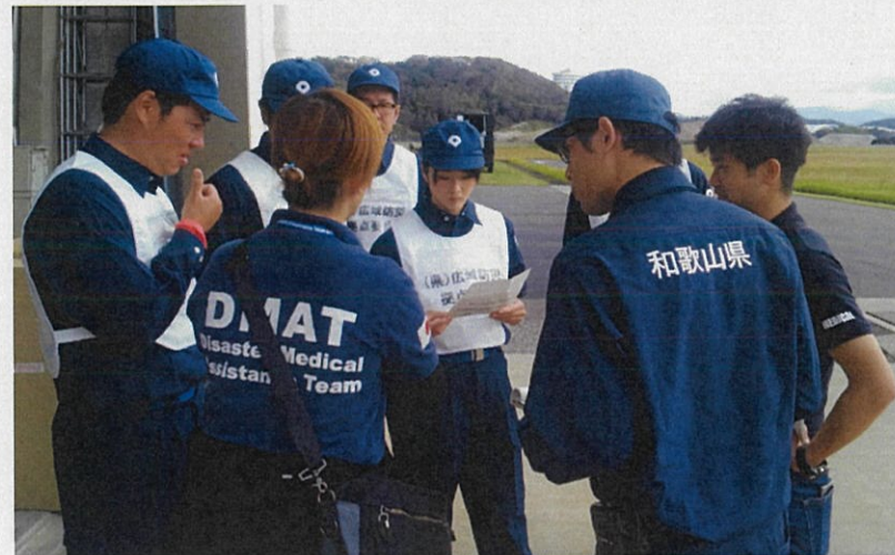
DMAT隊から説明を受ける県職員