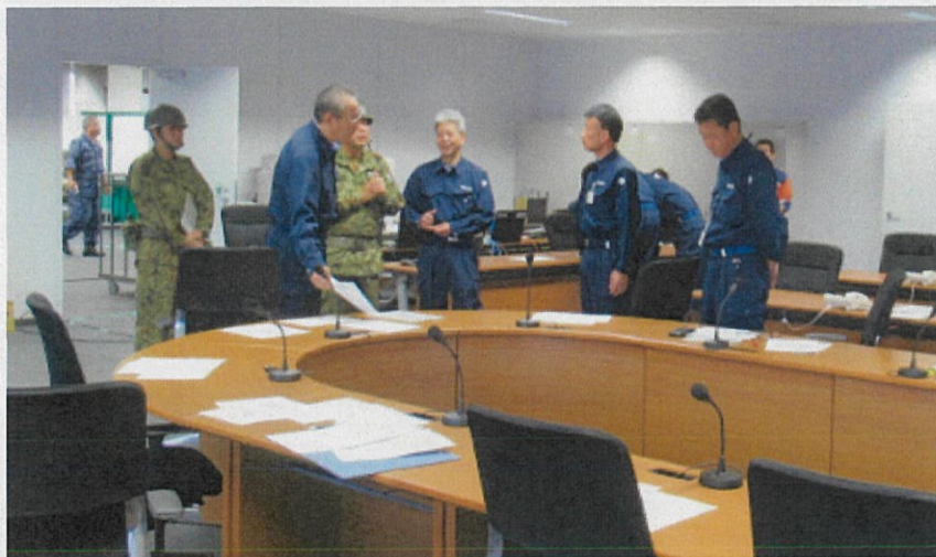
災害対策本部室で陸上自衛隊の活動状況について報告