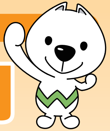
和歌山県PRキャラクター 「きいちゃん」