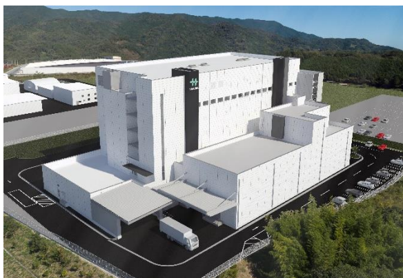
増設後の紀ノ光台工場イメージ (手前にある建物を増設)