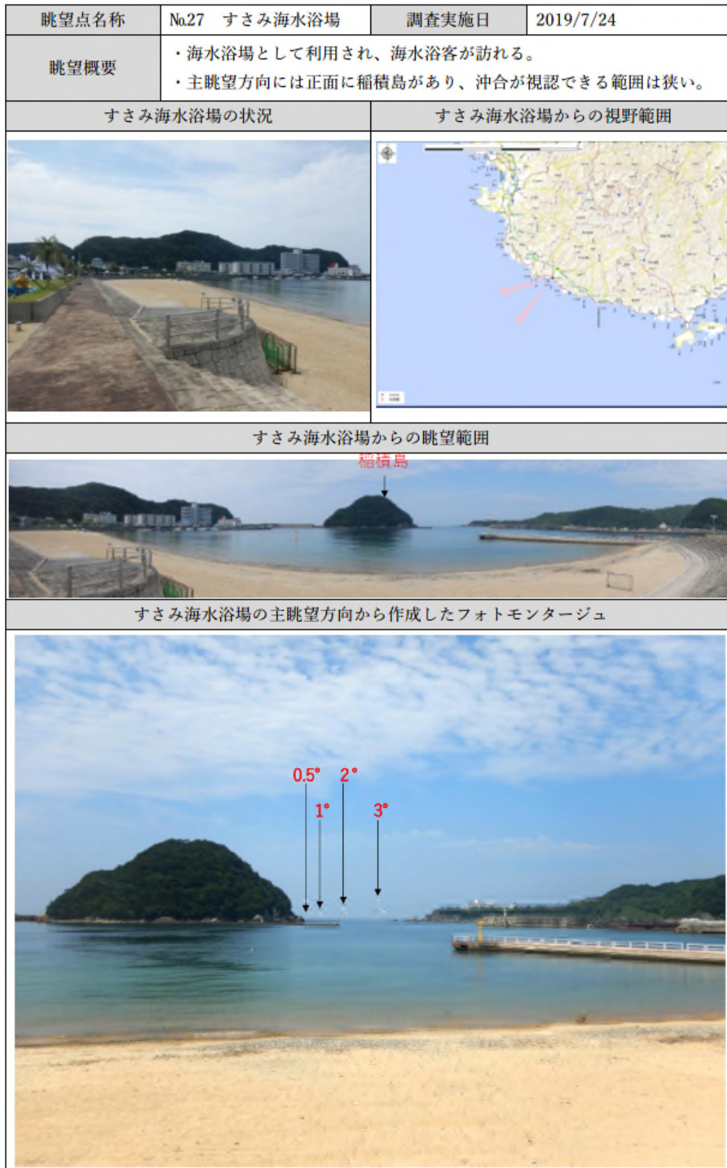
【別表1】眺望点からの景観(フォトモンタージュ)