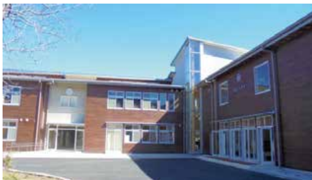
図1 左側正面:玄関ホール 右側:普通教室棟

平成29年2月竣工した「田辺市立新庄小学校」(木造2階建(一部鉄筋コンクリート造)延床面積2,929㎡)です。