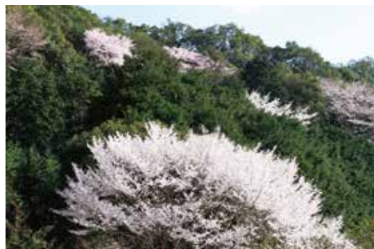
図3 クマノザクラの咲く里山(串本町)

クマノザクラは野生でも美しいという点で、他のサクラにない魅力を持ったサクラです(写真2)。しかし、野外に生育する個体によって開花時期、花の形態、花つきは様々です。このような野外集団から、観賞価値が高い個体(より花が美しい、病害虫に強い、成長が早い等)を選抜し、さらに利用価値が高い系統を育種することを目的に現在、研究をすすめています。