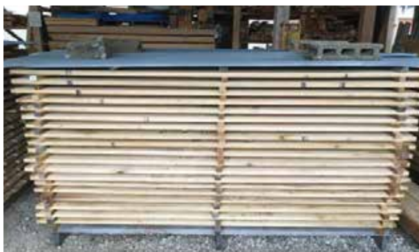
図1 シイ材の天然乾燥状況

試験区C：含水率40%天然乾燥材→含水率8%、乾燥温度38-45℃、平均湿度74.5%RH