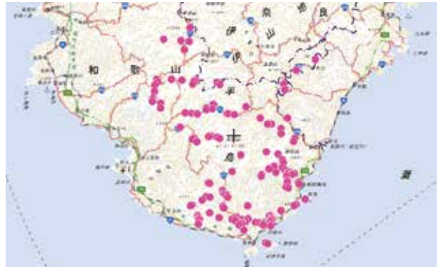
図3 クマノザクラの確認された地点(和歌山県内)

日高郡(みなべ町、日高川町)、田辺市、西牟婁郡(白浜町、すさみ町)、新宮市、東牟婁郡(那智勝浦町、太地町、古座川町、北山村、串本町)