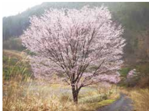
図2 満開になったクマノザクラ(田辺市)