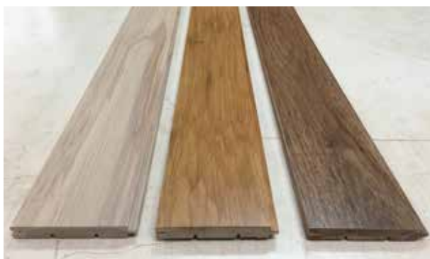
図2 シイフローリング材サンプル

試験材から幅105mm×厚さ15mm×長さ910mmのフローリングサンプルを作製しました。今後、公共施設を中心に普及を図ってまいります。