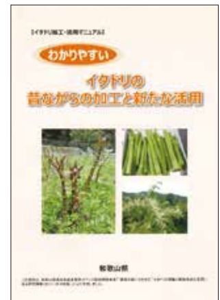
図3 加工・活用マニュアル