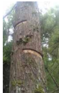
図2 環状剥皮したスギ

母樹の樹形は様々なため、剥皮の部位によりA~Dの4つのパターンに分けて調査したところ、いずれも無処理に対し収量は増加しました。