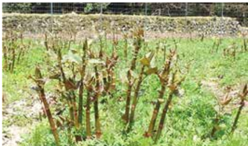
図1 収穫を迎えた栽培イタドリ

イタドリは、近年栽培に取り組む地域が増加し、県内各地で新たな商品が生まれています。