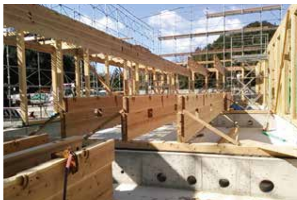
図3 2階床 重ね透かし梁

また、田辺地域において調達可能な無垢材の一般流通材にこだわった工夫が2階床の写真です。この梁材は上下に梁成300mmの平角と中央に240mmの平角を挟み込み、全体の断面が幅120mm×梁成800mmの重ね透かし梁となっています。通常は構造用集成材を使うところですが、他にも平角材(断面120×180mm)を柱材としても使っています。