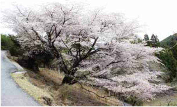
図1 満開になったクマノザクラ(古座川町)

紀伊半島南部で風変わりなヤマザクラとされていた淡紅色の花弁をもつサクラが、新たな野生種「クマノザクラ( Cerasus kumanoensis T.Katsuki)」として2018年春に発表されました。