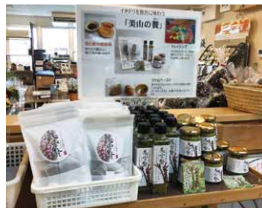
図4 「San Pin中津」で販売中の新商品 (健康茶、ドレッシング、ジャムペースト)

今回の研究成果を多くの方々に活用いただき、イタダリが“地域の稼ぐ力を生む”山菜になることを期待しています。