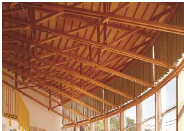
図2 校舎中央部の多目的ホール小屋組

このホールと各棟の間には防火壁(鉄筋コンクリート造)として玄関ホールと中央階段をそれぞれ配置することで、木造であるホールと各棟の延床面積を1,000㎡以下にし、裸木造を可能にしています。