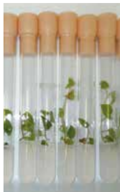
図1 組織培養による増殖

県内9地域から採取したイタダリの挿し木より得られた苗(17系統49株)を試験場内で育成し、各系統の収量や特性を調査しました。その結果、若芽の発生時期が早く、太くて収量が多く、皮が非常に剥きやすい「東牟婁3」を優良系統株として選抜しました。苗は組織培養により増殖を行い、6月に(一財)バイオセンター中津において優良系統苗として販売が開始されました。今年度分については完売しましたが、来年度も販売を行う予定です。