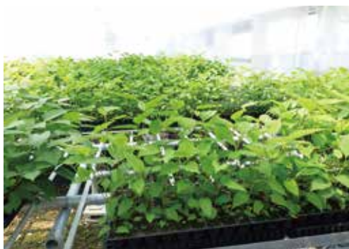
図2 バイオセンター中津で販売された優良系統苗