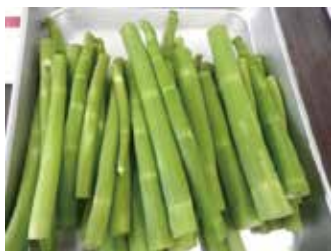
図2 茎の一次加工品開発

このため、今年度から長期安定栽培技術を開発するとともに、県工業技術センターと共同研究により、保存・流通に適した一次加工品の開発および根茎の化粧品利用など新たな分野での活用技術開発を行う研究を始めました。この研究により、イタダリの活用がさらに広がればと考えています。