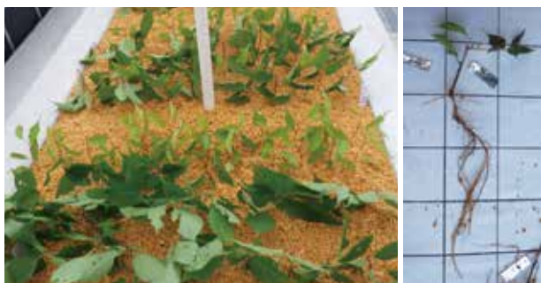
図1 クマノザクラ挿し木、発根した挿し枝

クマノザクラの実生での増殖は比較的容易ですが、親木の形質をそのまま受け継ぐ訳ではありません。一方、親木の形質を残したまま増やせる挿し木や接ぎ木などのクローン増殖技術はクマノザクラでは確立されておらず、特に挿し木による発根率は非常に低い結果となっています。この挿し木技術の向上させるために効率的なクローン増殖技術の研究を進めています。