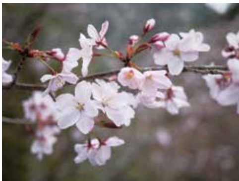
図2 クマノザクラの花

クマノザクラの主な特徴は、①開花が早く、個体によっては2月下旬から咲き始め、3月中旬～下旬に見頃を迎える、②葉が出る前に花が開く(写真2)、③白～淡紅色の花弁をもつ、④ヤマザクラよりも樹高が低く、枝が細いことです。以上から、緑化木や観賞木としての利用が期待されています。