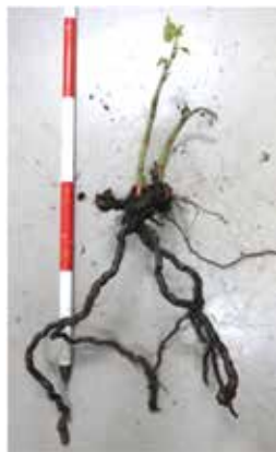
図3 イタダリの根茎活用